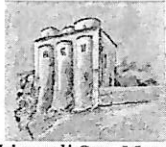
chiesa di San Marco (metà dell'XI secolo)

ISTITUTO COMPRENSIVO STATALE - "ALESSANDRO AMARELLI"-ROSSANO Prot. 0003916 del 04/06/2021 04-06 (Uscita)